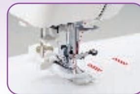
Boutonnière automatique en une phase à la taille du bouton , installez le à l'arrière du pied et réalisez une boutonnière impeccable en une seule opération