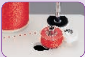
Débrayage automatique de la canette