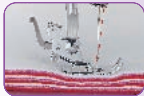
Couture dans les tissus épais grâce à la double hauteur du pied de biche et à la puissance de piqûre