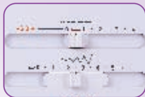
Réglage longueur et largeur des points