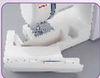
Table de couture avec les indications en inch et cm