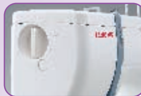
Pression du pied de biche réglable : Permet un entraînement régulier des tissus épais ou très fins et des tissus extensibles