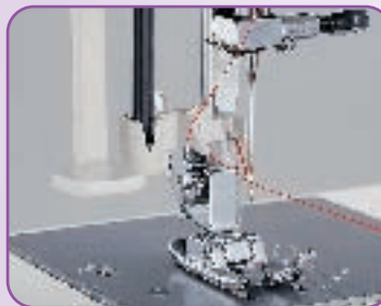
Enfilage automatique de l'aiguille